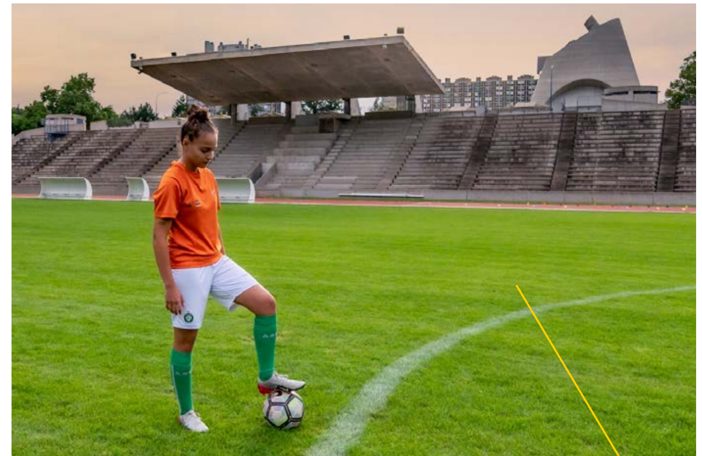
/ STADE LE CORBUSIER