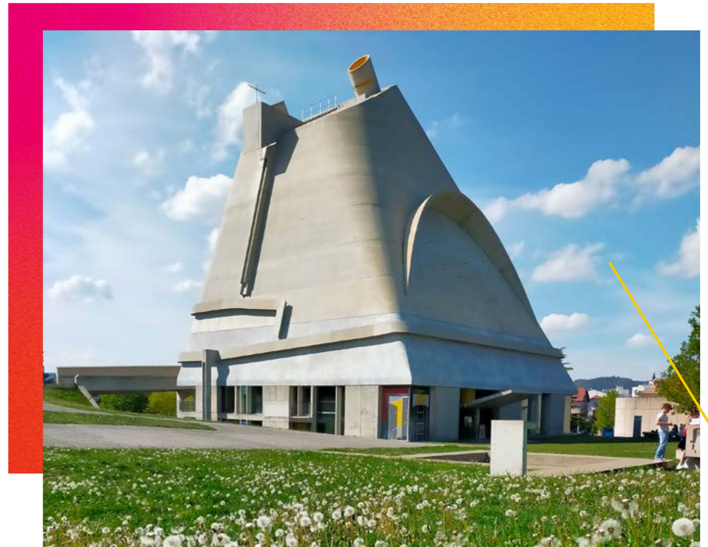
/ ÉGLISE SAINT-PIERRE DE FIRMINY-VERT