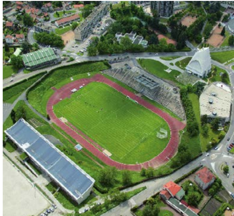
/ SITE LE CORBUSIER DE FIRMINY-VERT

Pour en savoir plus sur son histoire, découvrez notre dossier enseignants .