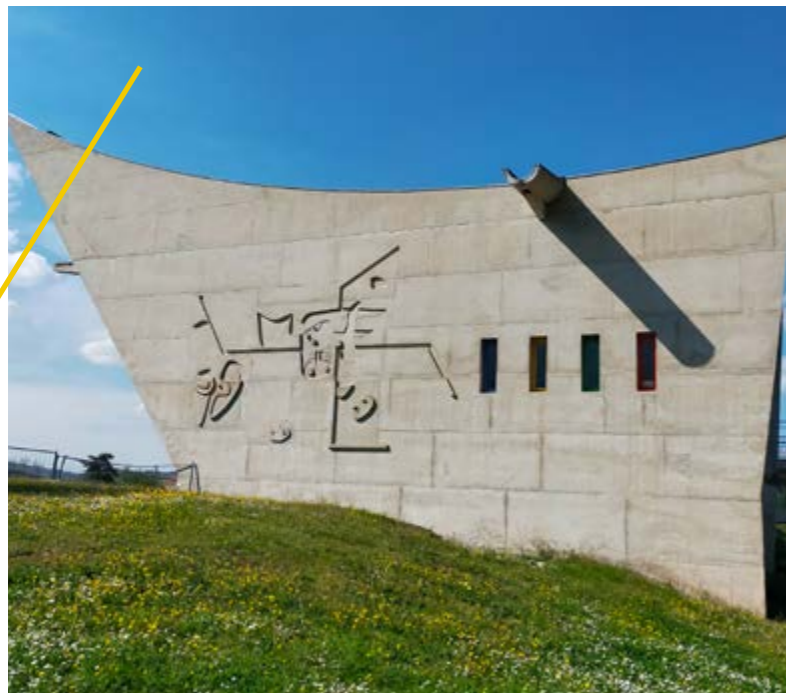
/ MAISON DE LA CULTURE, PIGNON SUD