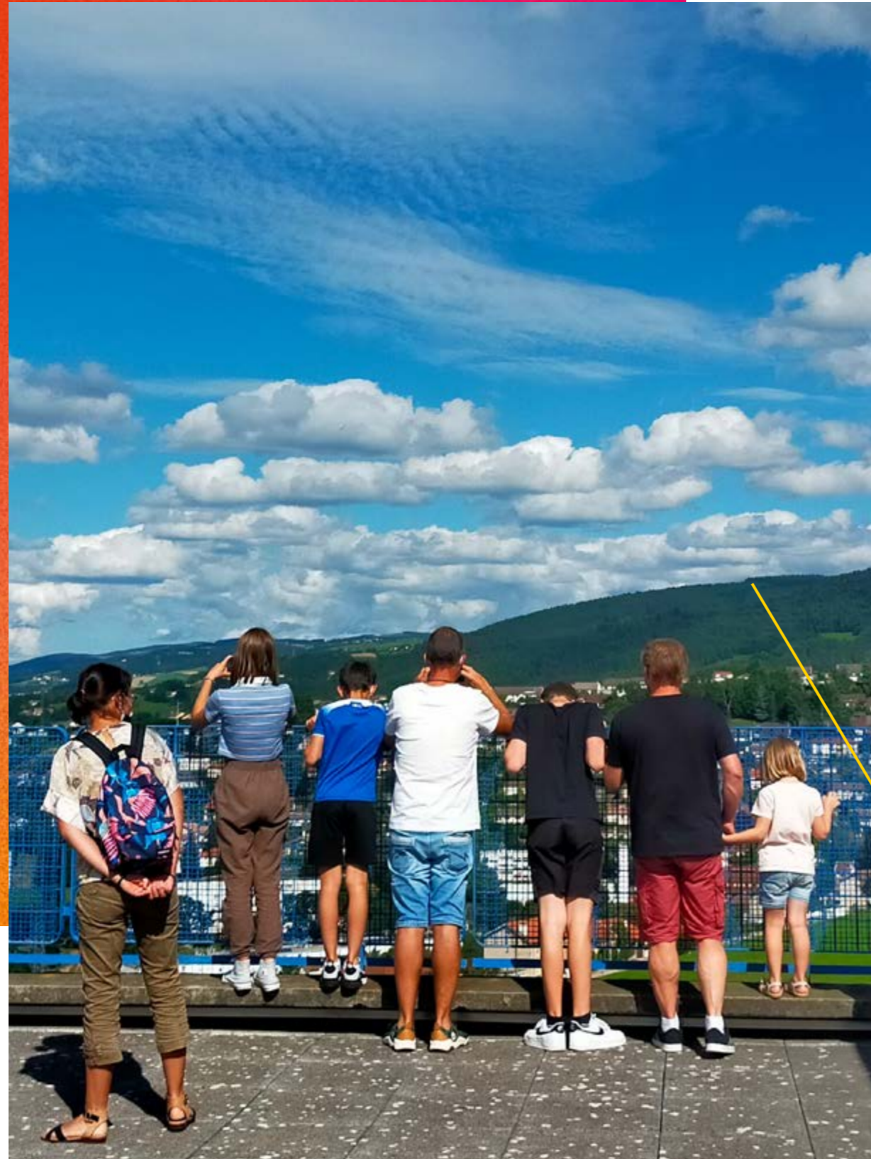
/ UNITÉ D'HABITATION, TOIT-TERRASSE