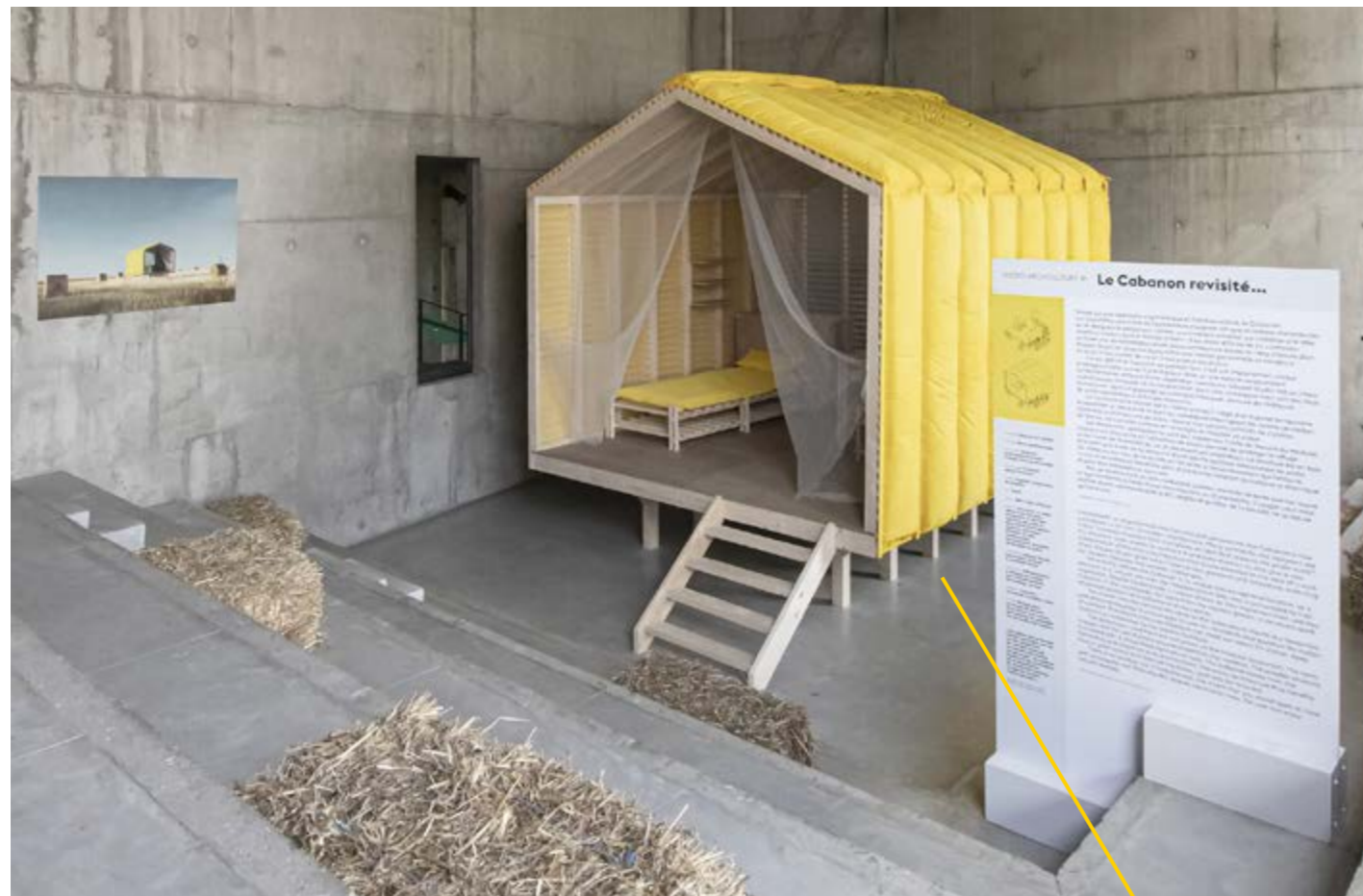
/ EXPOSITION LE CHAMP DES POSSIBLES - MICRO-ARCHITECTURES À EXPÉRIMENTER

Découvrez notre offre dédiée à l'exposition temporaire.