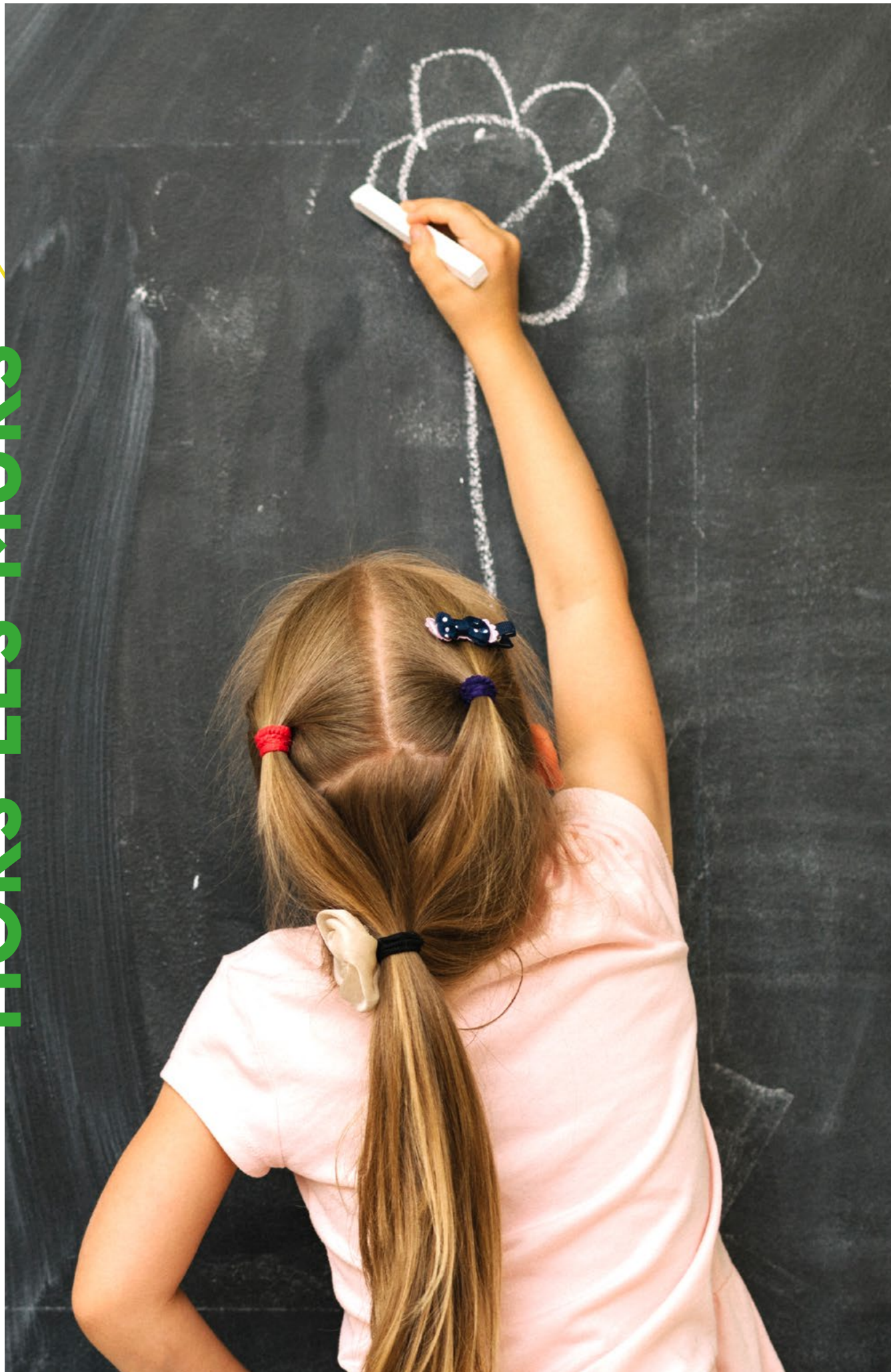
Intervention en classe