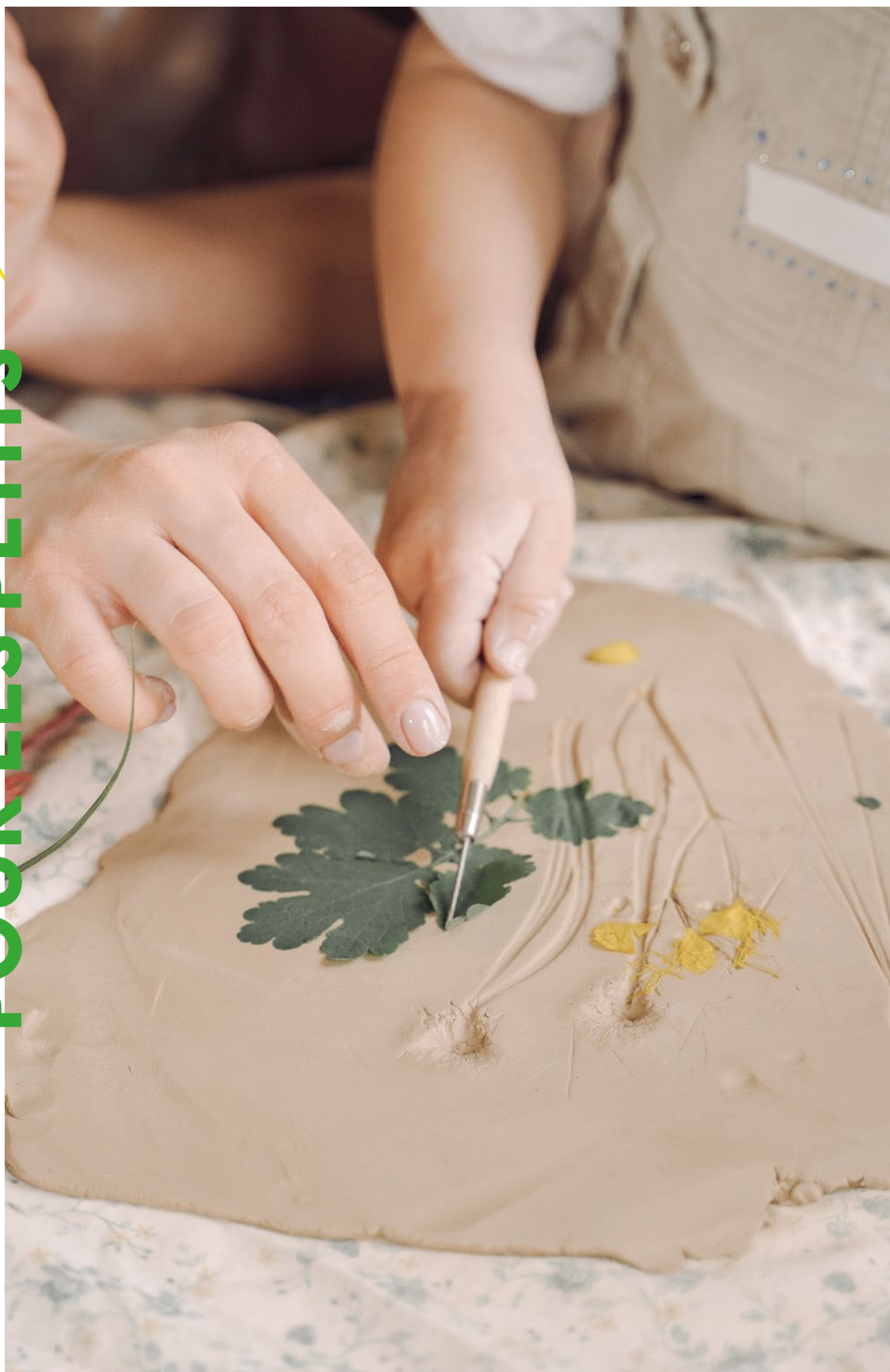
Atelier « empreintes végétales »