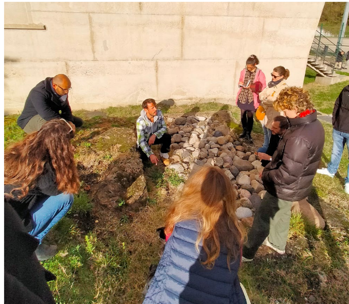
Découverte des plantes sauvages dans le quartier de Firminy-Vert

Thèmes abordés : espace vert – nature – urbanisme – ville – environnement Durée : 2h Cycles : dès le cycle 2 Lieu : quartier de Firminy-Vert ; en extérieur