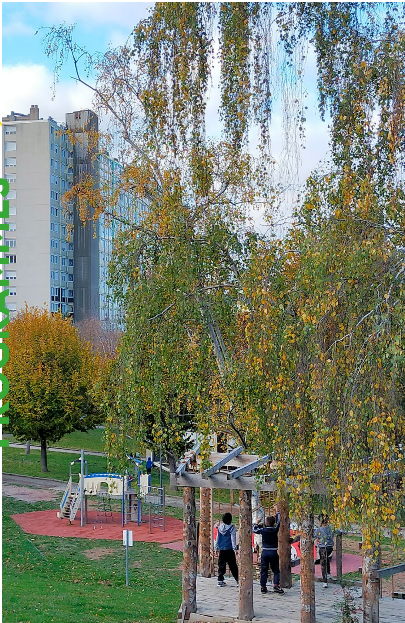
Firminy-Vert en 2023